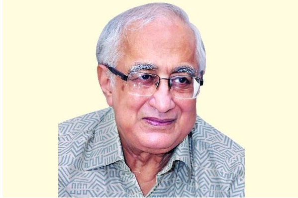
জামিলুর রেজা চৌধুরী