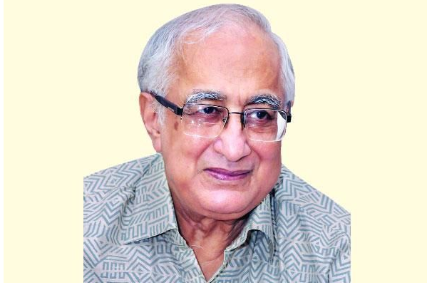
জামিলুর রেজা চৌধুরী