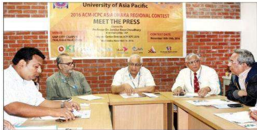
Guests attend a press briefing at University of Asia Pacific in the capital on Wednesday on 2016 ACM-ICPC Asia Dhaka Regional Contest to be held on the university campus on Friday.

ACM International Collegiate Programming Contest is an annual multi-tiered competitive programming competition for the universities across the world.