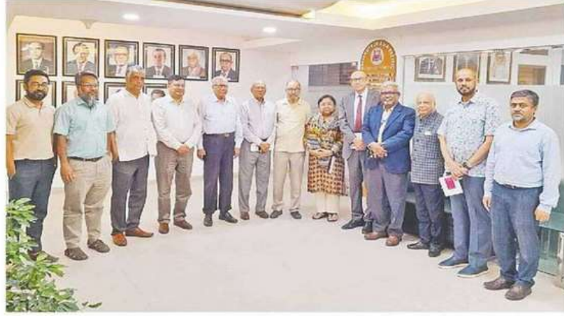
সৌজন্য সাক্ষাৎ শেষে ফটোসেশনে ইউনিভার্সিটি অব এশিয়া প্যাসিফিক (ইউএপি) ফিলিস্তিনের গাজার মুক্তবিশ্বস্ত অঞ্চলের ৩০ নারী শিক্ষার্থীকে সম্পূর্ণ বৃত্তি দেওয়ার সিদ্ধান্ত নিয়েছে। এর আওতায় বাসস্থান, ভ্রমণ খরচ, টিউশন ফি, স্বাস্থ্যসেবা ইত্যাদি থাকবে।