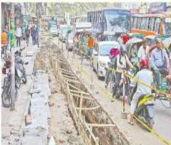
শিবচন্দ্রপুর শিবচন্দ্রপুর শিব থেকে মার্চি খণ্ডিত হয়ে এও গড়িতক ৩০ বছর টানা জরিমানা করা হয়েছে।